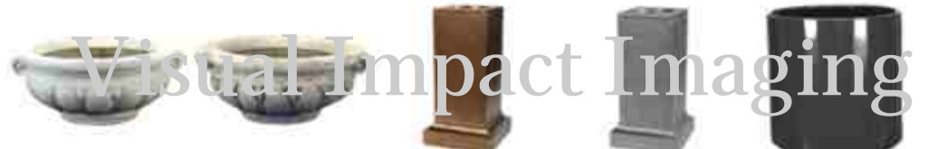
HFPW16S.tif HFPW16Z.tif HFT-J.tif HFT-P.tif HI1616-4.tif