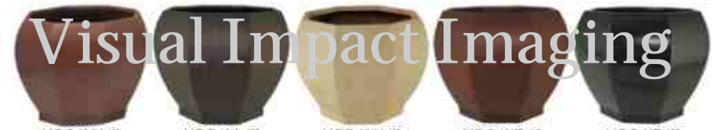
HOC-WH.tif HOC-WL.tif HOC-WN.tif HOC-WR.tif HOC-XB.tif