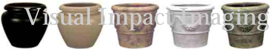
HV18SK.tif HV18ST.tif HW18-9.tif HW18S.tif HW18Z.tif