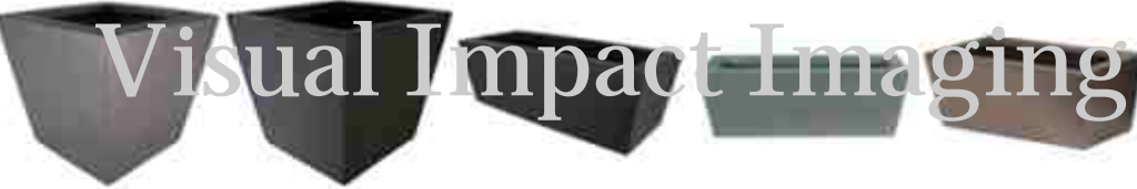
HWN-E.tif HWN-SK.tif HWRD-SK.tif HWRS-AL.tif HWRS-D.tif