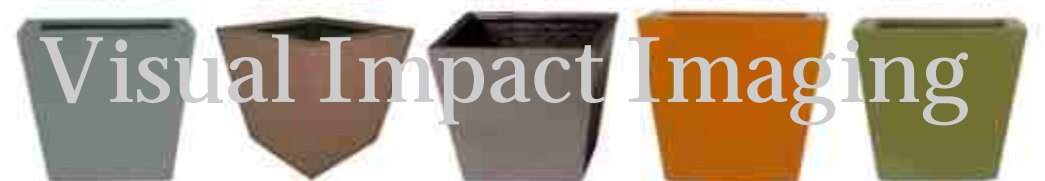
HWS-AL.tif HWS-D.tif hws-e.tif HWS-GM.tif HWS-GO.tif