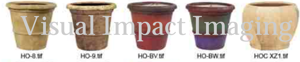
HO-8.tif HO-9.tif HO-BV.tif HO-BW.tif HOC XZ1.tif