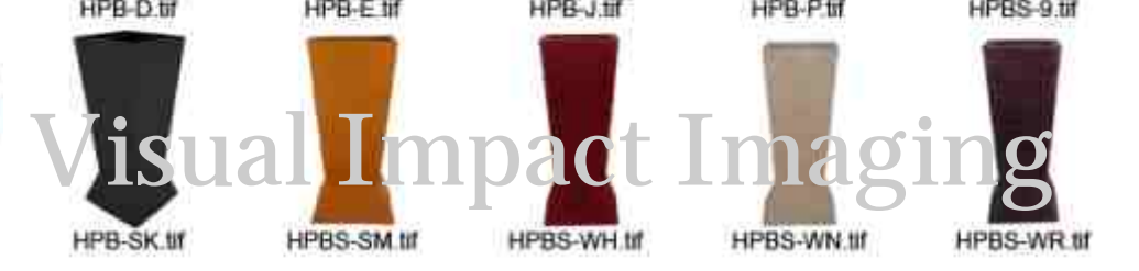
HPB-SK.tif HPBS-SM.tif HPBS-WH.tif HPBS-WN.tif HPBS-WR.tif