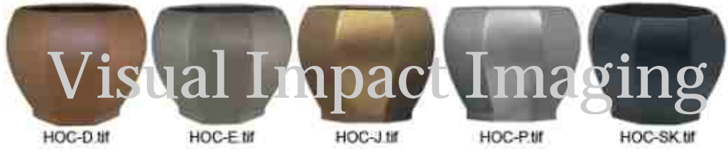
HOC-D.tif HOC-E.tif HOC-J.tif HOC-P.tif HOC-SK.tif