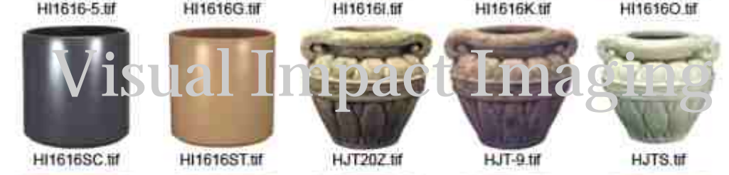
HI1616SC.tif HI1616ST.tif HJT20Z.tif HJT-9.tif HJTS.tif