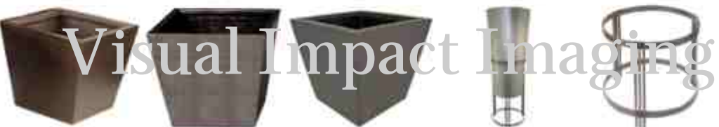
HWD-D.tif HWD-E.tif HWD-SK.tif HWI-HIGH ROU... HWI-LOW ROU...