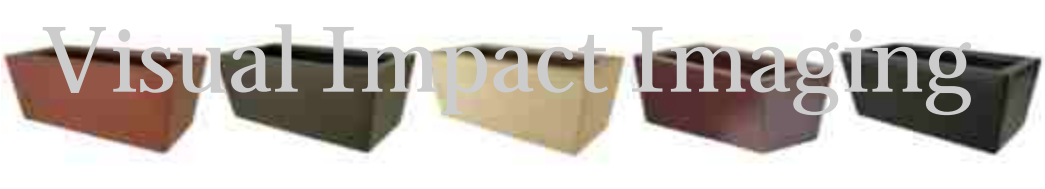
HWRS-WH.tif HWRS-WL.tif HWRS-WN.tif HWRS-WR.tif HWRS-XB.tif