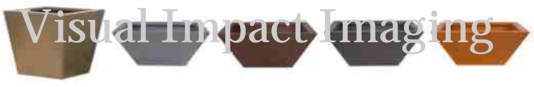
HWS-J.tif HWSL-AL.tif HWSL-D.tif HWSL-E.tif HWSL-GM.tif