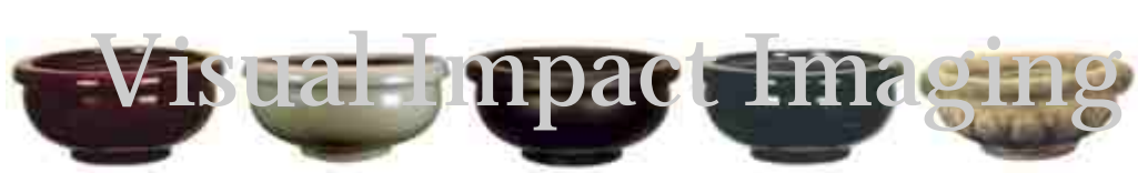
HFPP17O.tif HFPP17SG.tif HFPP17SK.tif HFPP-4.tif HFPW16-9.tif